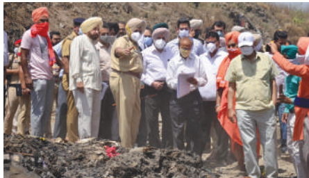
● दो हफ्ते बाद भी डंप पर लगी आग सुलगती देख निगम अफसरों की खिंचाई करती एनजीटी टीम।