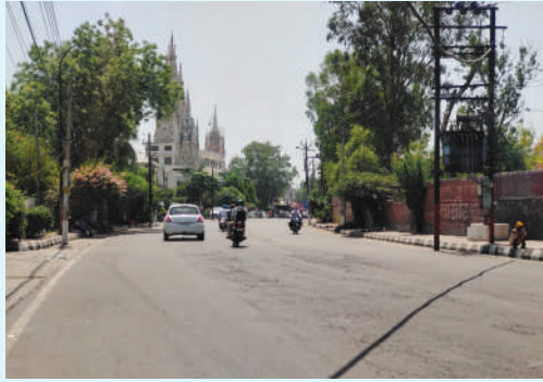
● महानगर में जग्राओं पुल से पहले श्री दुर्गा माता मंदिर के सामने वाली रोड पर जानलेवा गर्मी में सन्नाटा पसरा नजर आया।

लुधियाना/यूटर्न/27 अप्रैल। महानगर समेत पंजाब भर में मौसम का मिजाज तलख बना है, एक बार फिर से पारा चढ़ने लगा है। बुधवार को तीखी धूप से लोग पसीने से तरबतर हो रहे हैं। महानगर में तो सुबह ही तापमान 22-23 डिग्री सेल्सियस पहुंच गया था। साथ ही एयर क्वालिटी इंडेक्स 177 के स्तर पर था। दोपहर में तापमान 40 डिग्री सेल्सियस तक पहुंचने के साथ गर्म हवाएं चलने से खासकर बीमार लोग, बुजुर्ग और स्कूली बच्चे बेहाल नजर आए। लोग नींबू-पानी, गन्ने का रस, लस्सी पीकर भी थोड़ी देर राहत महसूस कर पाए।