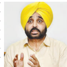
लिए जम्मू से भेजा गया है। सुल्तानपुर लोधी रेलवे स्टेशन के स्टेशन मास्टर के मुताबिक आज ही यह चिट्ठी मिली है। इस धमकी के बाद पंजाब में खुफिया विभाग सक्रिय हो गया है।

सुल्तानपुर लोधी / यूटर्न / 27 अप्रैल। पटियाला का काल माता मंदिर, बुधवार को पाकिस्तान पोषित आतंकी संगठन जैश-ए-मोहम्मद ने पंजाब को दहलाने की धमकी दी है। इस संबंध में सुल्तानपुर लोधी रेलवे स्टेशन के स्टेशन मास्टर को एक चिट्ठी मिली है। इस चिट्ठी में पंजाब को दहलाने की धमकी गई है। जानकारी के मुताबिक आतंकी संगठन जैश-ए-मोहम्मद के निशाने पर मुख्यमंत्री भगवंत मान, जालंधर स्थित श्री देवी तलाब मंदिर,