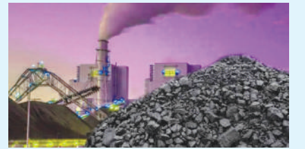
गई। जबकि मांग करीब 7457 मेगावाट रिकार्ड की गई। ऐसे में डिमांड व सप्लाय में बड़े फर्क की वजह से पावरकाम ने दो से छह घंटे तक कट लगाए। दूसरी तरफ कोयले का संकट भी थर्मल प्लांट में बढ़ रहा है।

लुधियाना/यूटर्न/27 अप्रैल। जानलेवा गर्मी के बीच इंडस्ट्रियल सिटी में भी बिजली संकट बढ़ने लगा है। इस नई मुसीबत के बढ़ने का खतरा बरकरार है। जिसके चलते भीषण गर्मी में लोग और बेहाल हो जाएंगे। मंगलवार को लुधियाना के कुछ इलाके में तकरीबन दो घंटे के पावर-कट लगे। जानकारी के मुताबिक पंजाब के पब्लिक-प्राइवेट सैक्टर के थर्मल प्लांट्स के 15 में से पांच यूनिटों में मंगलवार को बिजली उत्पादन बंद हो गया। इनमें तीन प्राइवेट व दो पब्लिक सैक्टर से हैं। जिससे राज्य में 2010 मेगावाट बिजली की शॉर्टेज हो