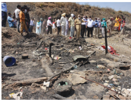
● जहां सात लोग जिंदा जले थे, उसका जायजा लेती एनजीटी की टीम।